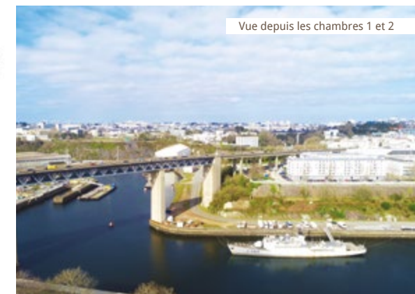
Vue depuis les chambres 1 et 2